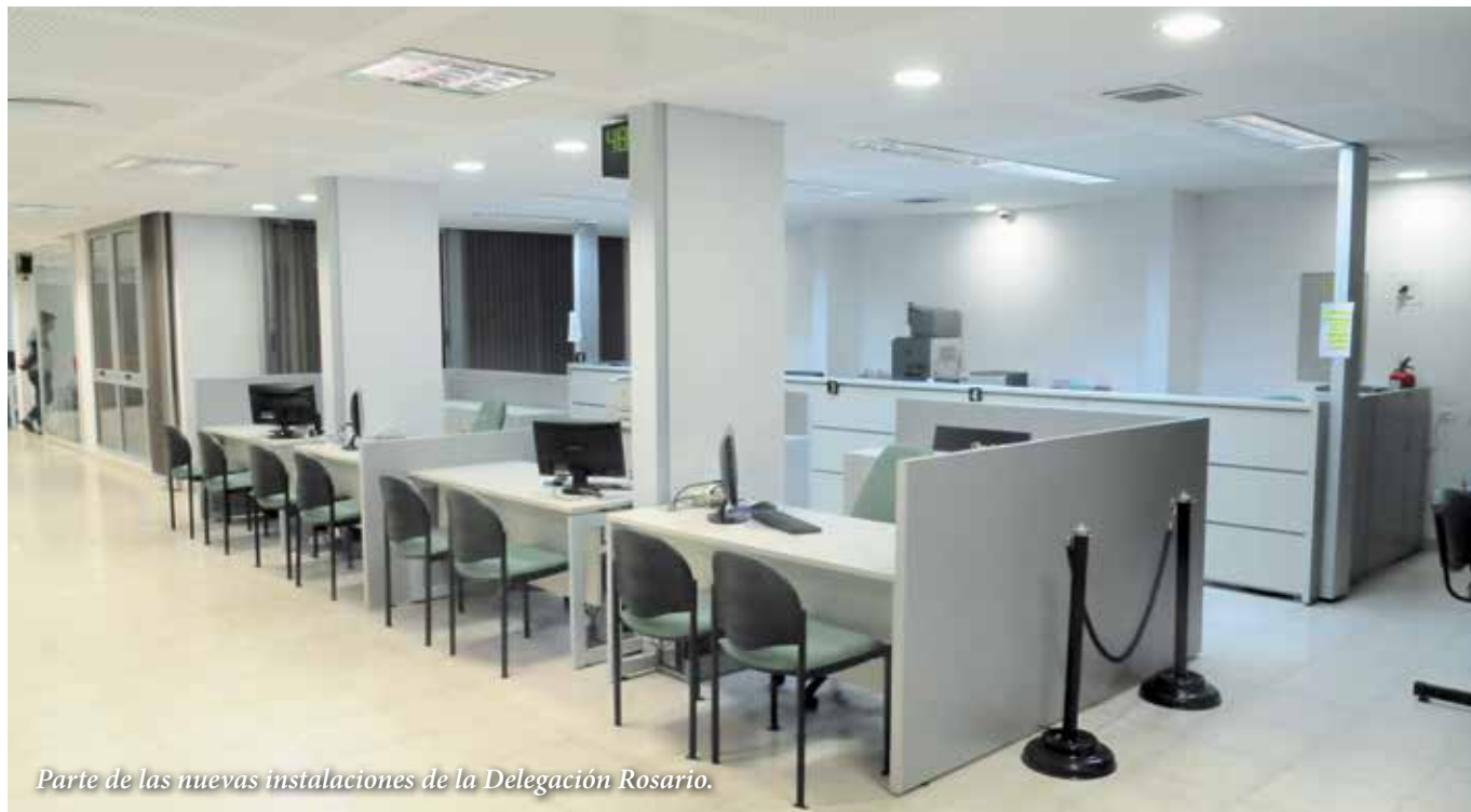
Parte de las nuevas instalaciones de la Delegación Rosario.